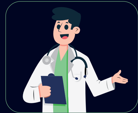
Atención médica extrahospitalaria de urgencia 1 (con o sin un traslado a un centro hospitalario)

Estos servicios puedes solicitarlos a través de nuestra línea única de atención a clientes al 55 5227 9000, opción 1.