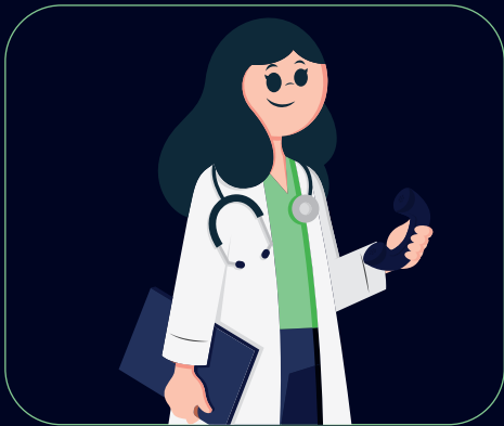
Orientación médica telefónica ilimitada